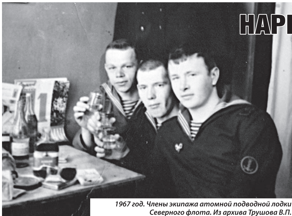
1967 год. Члены экипажа атомной подводной лодки Северного флота.

ЕСЛИ У ВАС ЕСТЬ ИНФОРМАЦИЯ О ФАКТАХ СБЫТА НАРКОТИКОВ ИЛИ ДРУГИХ ПРЕСТУПЛЕНИЯХ В СФЕРЕ НЕЗАКОННОГО ОБОРОТА НАРКОТИКОВ, ОБРАЩАЙТЕСЬ ПО ТЕЛЕФОНУ ДОВЕРИЯ УПРАВЛЕНИЯ ФСНН РОССИИ ПО ЛИПЕЦКОЙ ОБЛАСТИ (4742) 25-27-25 (КРУГЛОСУТОЧНО, АНОНИМНО)