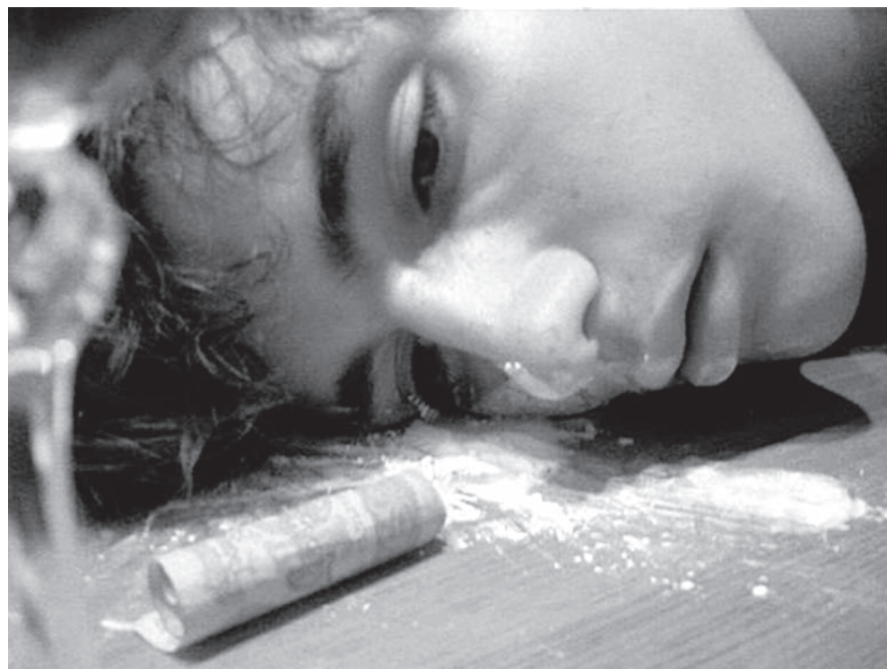
Начинала хорошо, завершила плохо.

В маленьком городке слухи распространяются быстро, но матери стоило