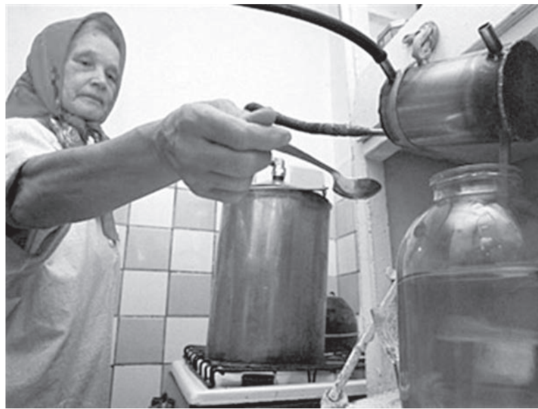
И приносит он доход, днем и ночью, круглый год.

Клинически доказано, что отравляющее действие даже очищенного самогона в 1,3 раза больше винного (этилового) спирта. Если человек, пристрастившийся к алкоголю (в просторечии – алкоголик) начал с употребления обычных спиртных изделий, предназначенных для пищевого потребления, а потом перешел к приему самогона и прочих суррогатов, у него быстро утрачивается чувство контроля. Утрачивается критическое отношение к собственному состоянию. Следующим заметным нарушением