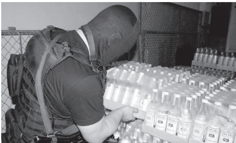
Эта отравка не дойдет до потребителя.