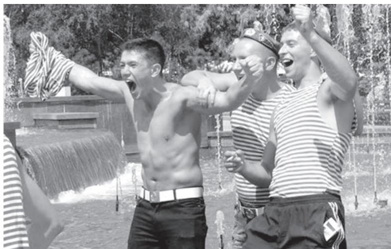
Никто кроме нас! Слава ВДВ!