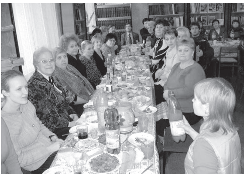
Корпоратив. Тосты за единство коллектива на старте, на финише – «Ты меня уважаешь?».

1 августа – День тыла Вооруженных сил РФ. Этот день отмечают те, кто служит и служил когда – либо в тыловых частях и подразделениях. Это и обеспечение войск продовольствием и организация питания. Это и материально – техническое обеспечение, в том числе обмундированием, средствами индивидуальной защиты, обслуживанием и ремонт вооружения, снабжение горюче – смазочными материалами, транспортное, в том числе железнодорожное обеспечение, медицинское обслуживание, финансирование и прочее, и прочее, и прочее.