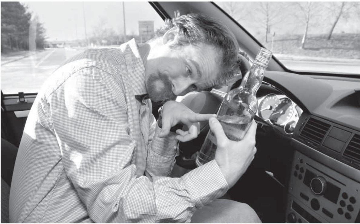
А вы знаете, кем я работаю?

Почему пьют дети интеллигентных родителей? Казалось бы – «приличный» ребенок, музыкальную школу закончил, мама – педагог, папа – инженер, а все – таки туда же. Есть ли взаимосвязь между заболеванием и уровнем интеллекта? Станет ли золотая медаль в школе и красный диплом в институте охранной грамотой от «зеленого змия»? Алкоголизм, как всякая другая болезнь, может возникнуть у кого угодно. Может ли ребе-