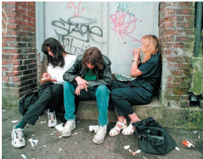
У них нет будущего (без реабилитации)

26 июня 2014 года по инициативе ЮНЕСКО отмечается Международный день борьбы с наркоманией . С 19.06.2014г. по 30.06.2014г. в Липецкой области проводятся мероприятия профилактической направленности. Наркомания не только медицинская проблема. Это – проблема безопасности страны. Наркомания и наркопреступность по существу уже приобрели все признаки глобальной угрозы безопасности нации. Несмотря на принимаемые меры соответствующих государственных структур, количество наркотических средств и психотропных веществ, находящихся в незаконном обороте, остается на высоком уровне. Современная наркоситуация в России характеризуется широкомасштабным незаконным оборотом и немедицинским потреблением наркотиков, таких, как героин, кокаин, стимуляторы амфитаминового ряда, лекарственных препаратов, обладающих психотропным воздействием, кодеинсодержащих препаратов, а также их влиянием на распространение ВИЧ – инфекции и СПИДА. Это представляет серьезную угрозу безопасности государства, экономике страны и здоровью ее населения. Обострилась проблема, связанная с вовлечением значительной части подростков