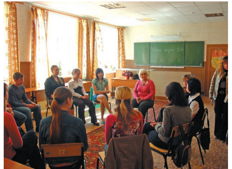
Скажи жизни – ДА!

Цифры и судьбы. По итогам I квартала 2014г. на диспансерном учете с диагнозом наркомания числилось 1665 человек, что на 3,1% ниже показателя начала квартала. Среди учетных наркоманов 247 женщин. Дополнительно к этому на ранних формах потребления наркотиков в