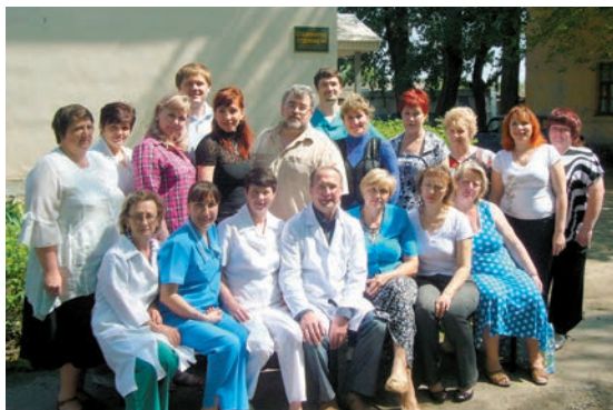
Сотрудники стационарного отделения №4