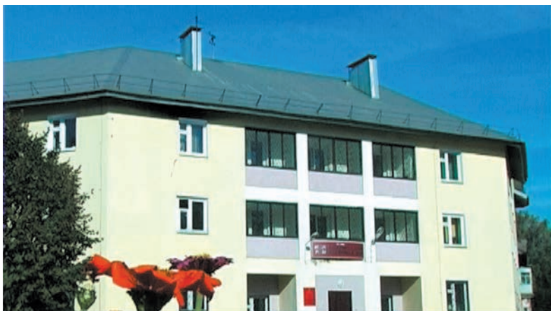
Стационарное отделение №2 с элементами реабилитации