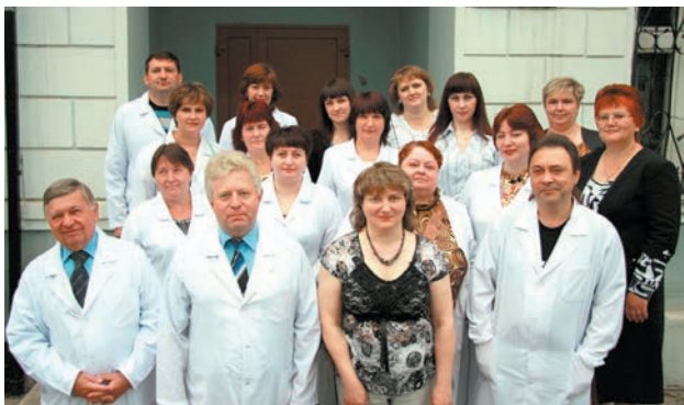
Сотрудники административного корпуса

Межведомственное взаимодействие. В плане профилактики наркологических расстройств налажены деловые и продуктивные связи с административными комиссиями антинаркотической направленности различных уровней, образовательными и правоохранительными учреждениями, многочисленными общественными организациями, руководством Липецкой и Елецкой Епархии РПЦ, с областным Центром профилактики и борьбы со СПИД и инфекционными заболеваниями, средствами массовой информации. Вода и камень точит. Зло стало медленно отступать.