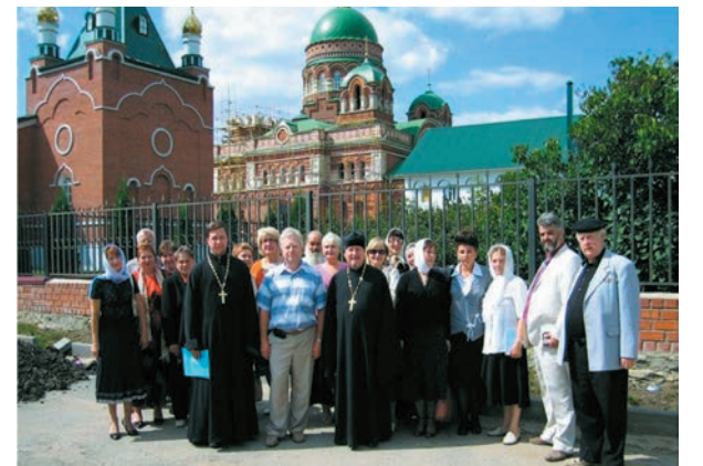
Наркологи и священнослужители за здоровый образ жизни

Обслуживаемая территория – Липецкая область с населением 1 млн.162 тыс. 235 человек (на 1 января 2013г.). женщины составляют 54,4%. Количество учащихся: в школах в возрасте 13-17 лет – 104,8 тыс. чел.; ПУ – 16,6 тыс. чел.; студентов в ВУЗАХ – 63 тыс. 500 чел. Наркослужба работает в тесном взаимодействии с административными комиссиями антинаркотической направленности всех уровней, образователь-