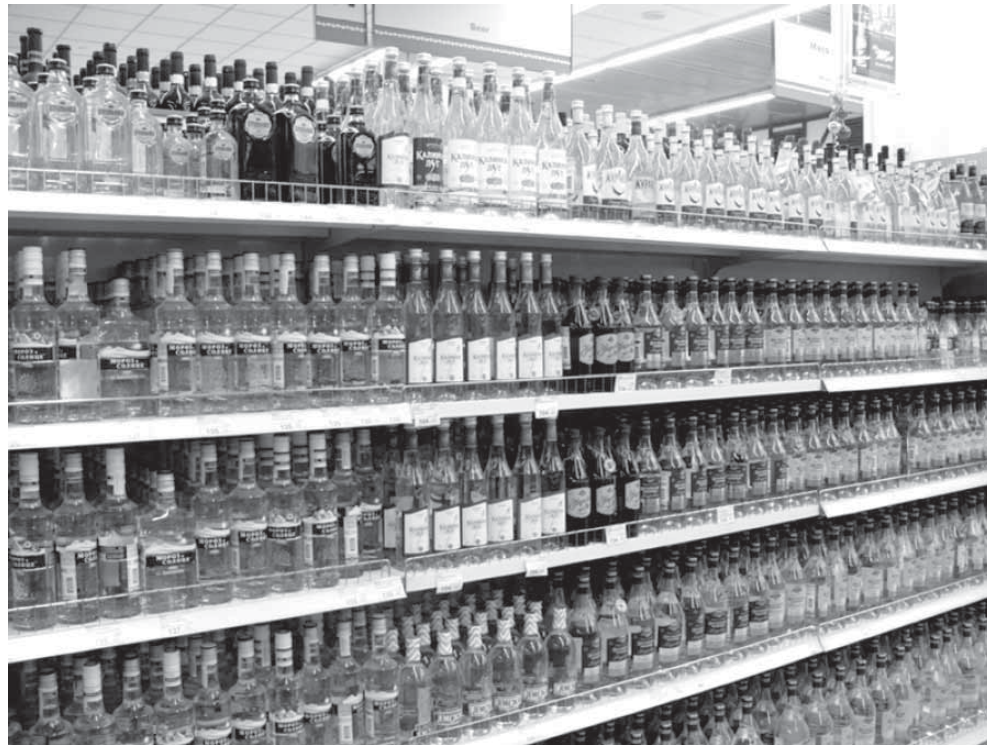
И эта продукция будет выпита народом до последней капли

Отдельные статистические показатели. Из числа всех, кому в той или иной степени необходима помощь нарколога, на учет, как правило, попадает один из десяти. Остальная часть населения прибегает к так называемым «народным» средствам облегчения самочувствия после обильного потребления алкоголя. Вместе с тем, по данным первого полугодия 2014 г. в Липецкой