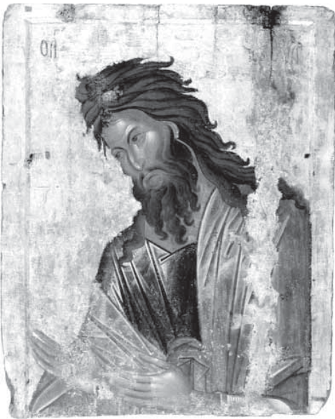
Иоанн Креститель (византийская икона, XIV век)

В Липецкой области за период с 2003 по 2014 год постоянное население уменьшилось на 51,1 тысячи человек. А за период с 1 января 1998 по 1 января 2013 года (за 15 лет) нас стало меньше на 115,6 тысяч. Среди прочих причин демографического спада проблема алкоголизации населения является, отнюдь, не последней. Тема протрезвления народа для России не нова. Вместе с тем. Кое – что нас обнадеживает. Наметилась тенденция к повышению рождаемости. Продолжительность жизни в современной России в последние годы возрастает, но всё же остается одной из самых коротких среди цивилизованных стран мира. Особое беспокойство вызывает высокая смертность мужчин в трудоспособном возрасте.