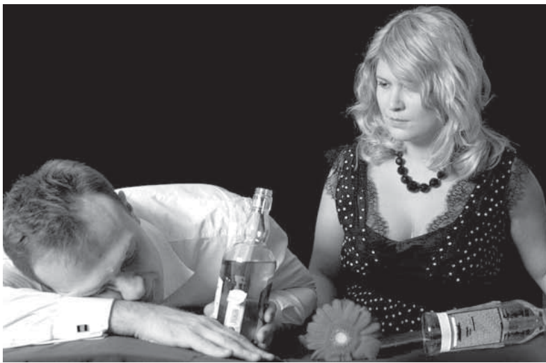
Ты заболеешь, я приду, боль разведу руками Все я сумею, все смогу, сердце мое не камень

ровка ответа в целом похожа в созависимых семьях: «хорошо, лечиться пойду, но я не алкоголик!» (трудно представить чтобы женщина сказала: «хорошо я пойду делать аборт, но запомните, я не беременна!» При обращении к специалисту (наркологу или психологу), родственники искажают анамнестические сведения. Разговор носит следующий смысл: «Он у нас не алкоголик, но его надо почитать! Но когда он трезвый – он хороший отец, у него золотые руки, умная голова, но вот выпьет, дурак – дураком! Да и друзья его с толку сбивают!». Вариантов множество. Сообщения о стадии личностных изменений, как правило, носят диссимулятивные проявления, то есть характеристика явных болезненных расстройств преподносится в смягченной форме. Пренебре-