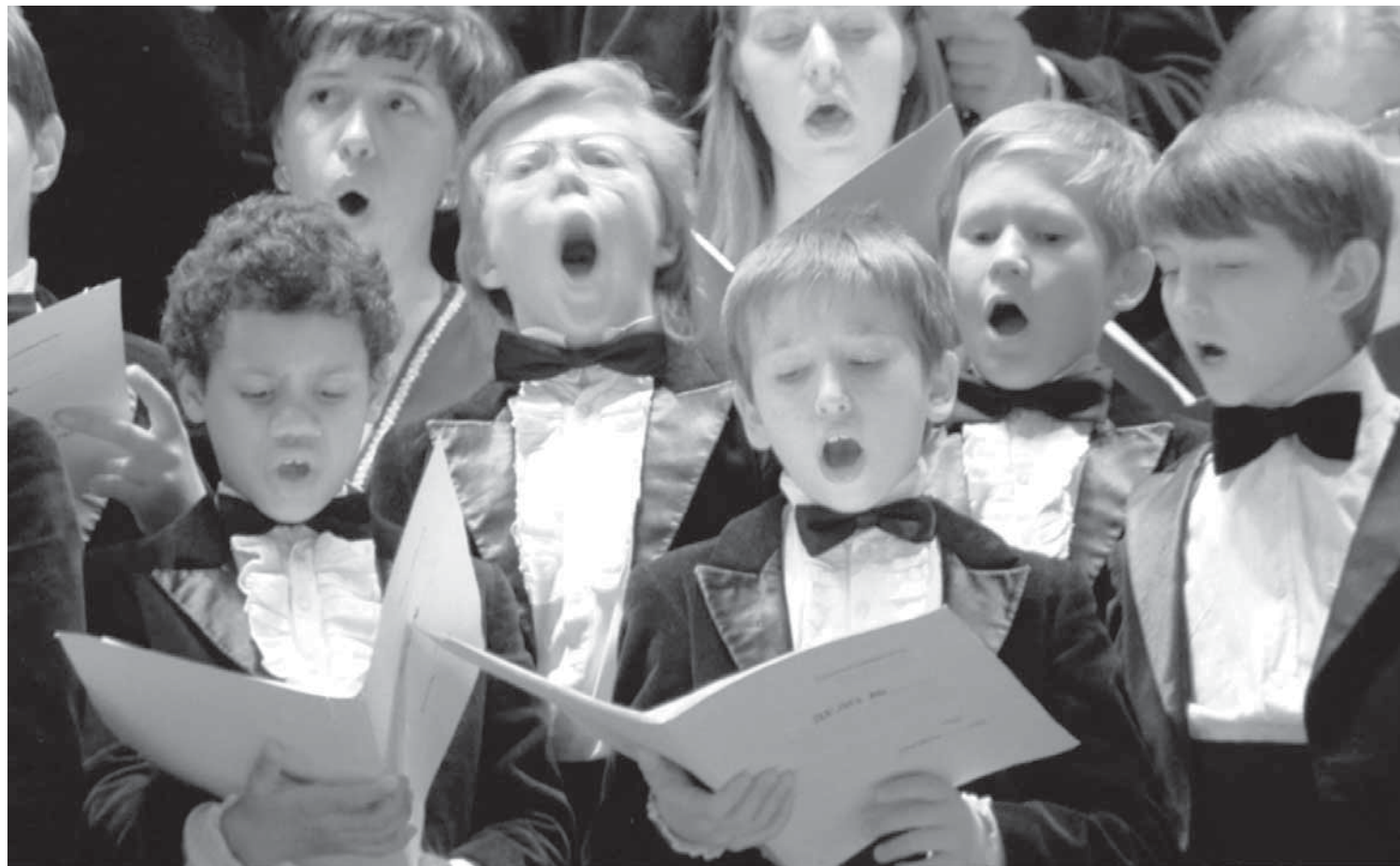
Наркоту не потреблять, не курить, не выпивать Учат в школе, учат в школе, учат в школе!

с 1 по 11 классы». В это же время в ГУЗ «ЛОНД» под авторством Трушова В.П. выходит книга «Профилактика наркомании, токсикомании и табакокурения среди учащихся школ, ПУ и ССУЗов. Методические рекомендации. Пособие для учителя». В этой книге содержалась целая программа по методике проведения уроков трезвости с 1 по 11 классы школы и с 1 по 3 курс для учащихся ПУ и ССУЗов. По сути, Липецкая область на целых три года опередила Москву. В Липецком областном институте развития дальнейшего образования и на факультете повышения квалификации преподавателей ЛГПУ были внедрены соответствующие тематические разделы. Наркологи совместно со специалистами областного центра профилактики и борьбы со СПИДом и ИЗ на регулярной основе проводят соответствующие семинары для преподавателей в образовательных учреждениях г. Липецка и г. Ельца, а также в районах области. Более того, выполнению всей этой работы обязывают соответствующие нормативные документы. К ним относятся. Государственный стандарт первичной профилактики злоупотребления психоактивными веществами в образовательной среде.